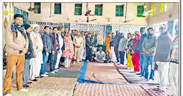
सिरसा। गुरु रविदास जयंती मनाते लोम।