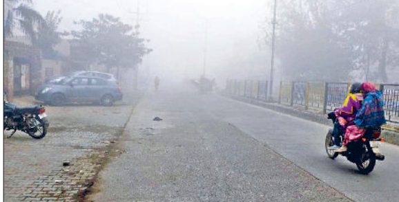
फतेहाबाद। शहर में छाई धुंध व बादलवाही।

पश्चिमी विक्षोभ के प्रभाव से रविवार अलसुबह फतेहाबाद में बादल छा गए और हल्की बरसात दर्ज की गई। रविवार को दिनभर बादल छाये रहे और तेज ठंडी हवाएं चलती रही। बरसात के बाद यहां के तापमान में बढ़ोतरी दर्ज की गई। रविवार को यहां का अधिकतम तापमान 22 डिग्री व न्यूनतम तापमान 10 डिग्री दर्ज किया गया। कृषि विशेषज्ञों का मानना है कि बरसात और ऐसा मौसम गेहूं की फसल के लिए काफी लाभदायक है।