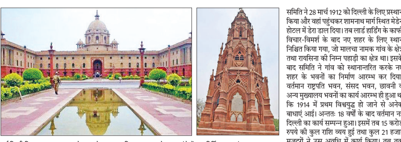
नई दिल्ली स्थित वायसराय हाउस जो 1947 के बाद राष्ट्रपति भवन कहा जाने लगा। अंग्रेजों द्वारा निर्मित 1857 संग्राम का स्मारक।

वर्ष 1912 तक अंग्रेजों ने भारत में अपना साम्राज्य कलकत्ता को राजधानी बनाकर कायम किया था। बता दें कि तीसरे दिल्ली दरबार में 12 दिसम्बर 1911 को अंग्रेज सम्राट जार्ज पंचम ने दिल्ली को राजधानी घोषित किया था। दिल्ली का तीसरा दरबार अण्डरजी नगर के पास कोरोनाशन पार्क में लगा था, जिसमें प्रथम बार कोई बरतानवी सम्राट महाराना मेरी पधारें थे। उस समय भारत का अंग्रेज वायसराय लॉर्ड हार्डिंग था। सम्राट के साथ भारत मन्त्री मार्कविश क्रीऊ भी आया था। उस भव्यतम दरबार में भारतीय देशी शासकों, नवाबों व राजाओं के लिए सिविल लाइन में अलग से शिविर लगाए गए थे। दरबार स्थल के पास सम्राट ने अंग्रेजों की नई राजधानी की आधारशिला रखी थी। कहा गया था कि आने वाले कुछ ही वर्षों में इस स्थान पर भव्य इम्पीरियल राजधानी स्थापित होगी, लेकिन उसी दौरान कुछ ऐसी घटनाएँ हुई थी जिसको अंग्रेजों के लिए अपशुक्रन कहा जाता है। प्रथम तो जार्ज पंचम विलायत से चले तो दुर्घटना हुई थी। दूसरी घटना, दरबार करने के बाद सम्राट के खेमे में आग लग गई। तीसरी, लार्ड हार्डिंग के जुलूस निकालते समय 23 दिसम्बर को उनके हाथी पर चाँदनी चौक में बम से हमला किया गया, लेकिन उनसे भयभीत हुए बगैर लार्ड हार्डिंग ने कलकत्ता से दिल्ली राजधानी स्थानान्तरण का कार्य आरम्भ रखा। वह अपना प्रशासनिक मुख्यालय दिल्ली यूनिवर्सिटी में स्थापित करके विधिवत योजना बनाने में व्यस्त रहे। मेटकाफ हाऊस को काउंसिल हाउस के तौर पर प्रयोग किया गया।