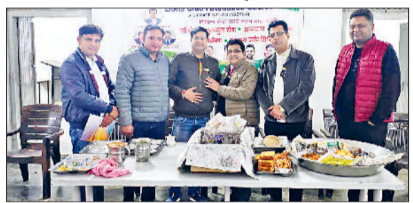
फतेहाबाद। गुरुकुल मातना में बच्चों को अल्पाहार वितरित करते क्लब सदस्य।