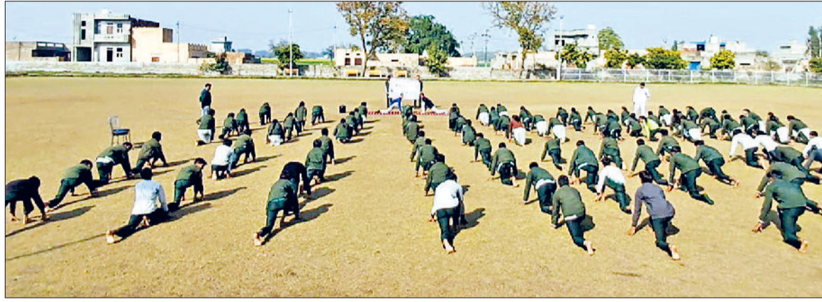
फतेहाबाद। पीएम श्री विद्यालय शेखपुर दड़ौली में सूर्य नमस्कार का अभ्यास करते विद्यार्थी।