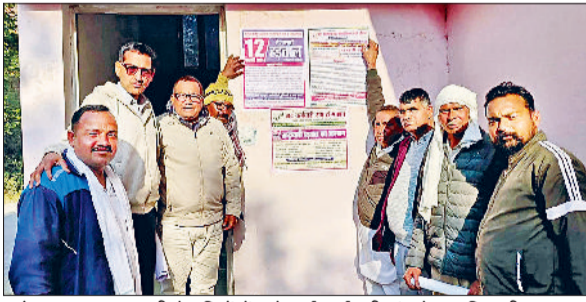
फतेहाबाद। हड़ताल की तैयारियों में जुटे सर्व कर्मचारी संघ के पदाधिकारी।

फतेहाबाद। सीआईए रतिया ने बिजली ट्रांसफार्मर से तेल चोरी के मामले में कार्रवाई करते हुए दो आरोपियों को काबू किया है। सीआईए रतिया प्रभारी सहायक उप निरीक्षक रिष्पाल ने बताया कि बिजली निगम से प्राप्त लिखित शिकायत के आधार पर थाना सदर रतिया में अभियोग दर्ज किया था।