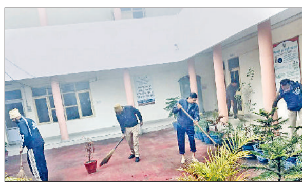
फतेहाबाद। थानों में साफ-सफाई करते पुलिस कर्मचारी।

फतेहाबाद पुलिस द्वारा जिलेभर में रविवार को स्वच्छ थाना-चौकी अभियान चलाया गया। सुबह-सवेरे पुलिस कर्मचारी थानों व चौकियों में साफ-सफाई करते नजर आए। इस अभियान का उद्देश्य थाना व चौकी परिसरों को स्वच्छ, सुव्यवस्थित और नागरिकों के लिए अधिक अनुकूल बनाना है, ताकि पुलिसिंग के प्रति विश्वास बढ़े और आमजन को बेहतर वातावरण मिल सके। अभियान के तहत जिले के सभी थानों व चौकियों में पुलिस अधिकारी एवं कर्मचारी टीम भावना